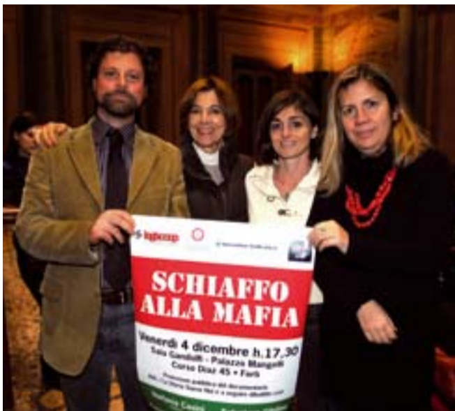
Gli incontri si sono tenuti nella Sala Gandolfi e all'Aula Mazzini 1 dell'Università.

Un rapporto iniziato nel 2007, con la donazione di un trattore e di un aratro da parte di Legacoop e CIA Forlì-Cesena, e proseguito nel tempo con varie importanti iniziative della cooperativa Formula Servizi: il contributo per l'apertura del punto vendita di Palermo, la scelta di realizzare pacchi natalizi ai soci con i prodotti di Libera Terra, la donazione di un pick-up e il contributo fornito al documentario Schiaffo alla Mafia , realizzato dalla re-