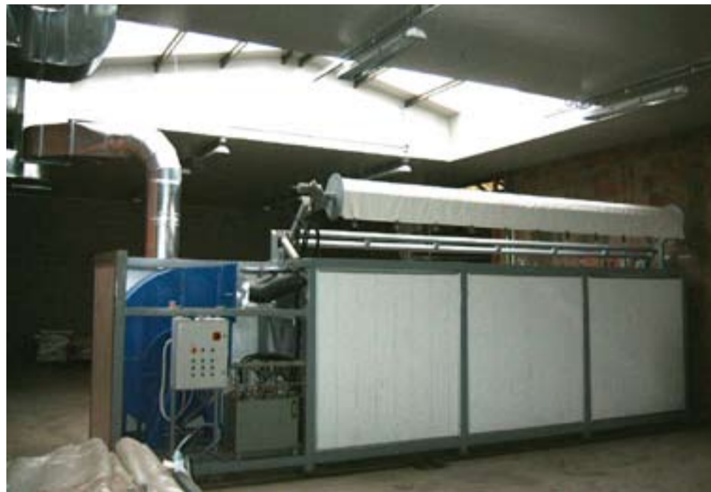
La macchina di lavaggio e la vasca di decantazione dell'impianto di depurazione e filtraggio delle acque reflue installate dalla cooperativa Pubblifest.

Feynman ovviamente scherzava: la sua grandezza