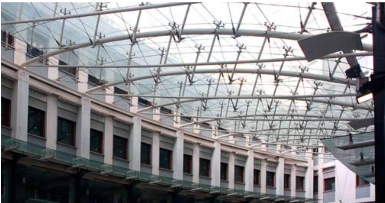
Sopra: un lavoro di particolare complessità realizzato a Milano. In basso il nuovo stabilimento di Villa Selva.

Coveri non perde però il consueto ottimismo. «La Lombardia resta il nostro mercato principale - spiega