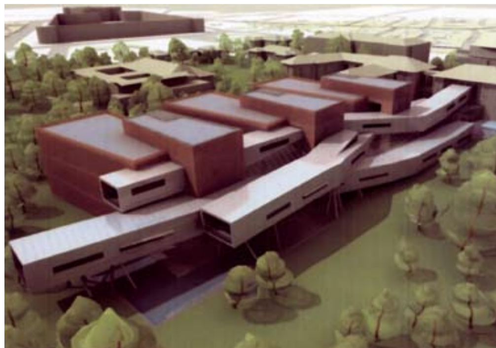
Un prospetto del nuovo campus di Forlì che sta sorgendo in centro storico, sull'area del vecchio ospedale Morgagni.

In primavera è previsto l'avvio dei lavori, con la