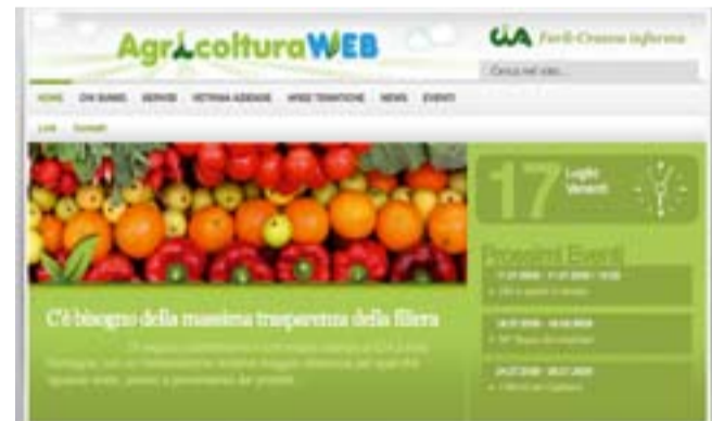
Il nuovo portale è stato promosso da CIA Forlì-Cesena.