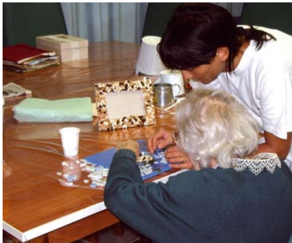
Le cooperative sociali si occupano di assistenza, ma anche di inserimento di soggetti svantaggiati.

C'è poi l'accentuata propensione a svolgere direttamente determinati servizi, evitando di esternalizzarli a società non profit. Terzo, la pratica del massimo ribasso che non rispetta nemmeno le tariffe minime orarie sul