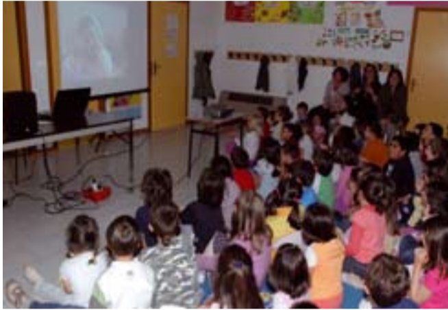
Una classe di Prevescuò alle prese con una lezione.

È quanto previsto da "Prevescuò, a lezione di salute", il progetto promosso da Legacoop Forlì-Cesena, Lilt e Irst per diffondere nelle scuole della nostra provincia corrette abitudini alimentari e sani stili di vita tra le generazioni più giovani. «Dopo la positiva esperienza dello scorso anno, con oltre trenta