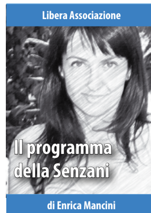
Il programma della Senzani