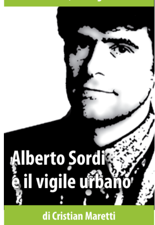
Alberto Sordi e il vigile urbano