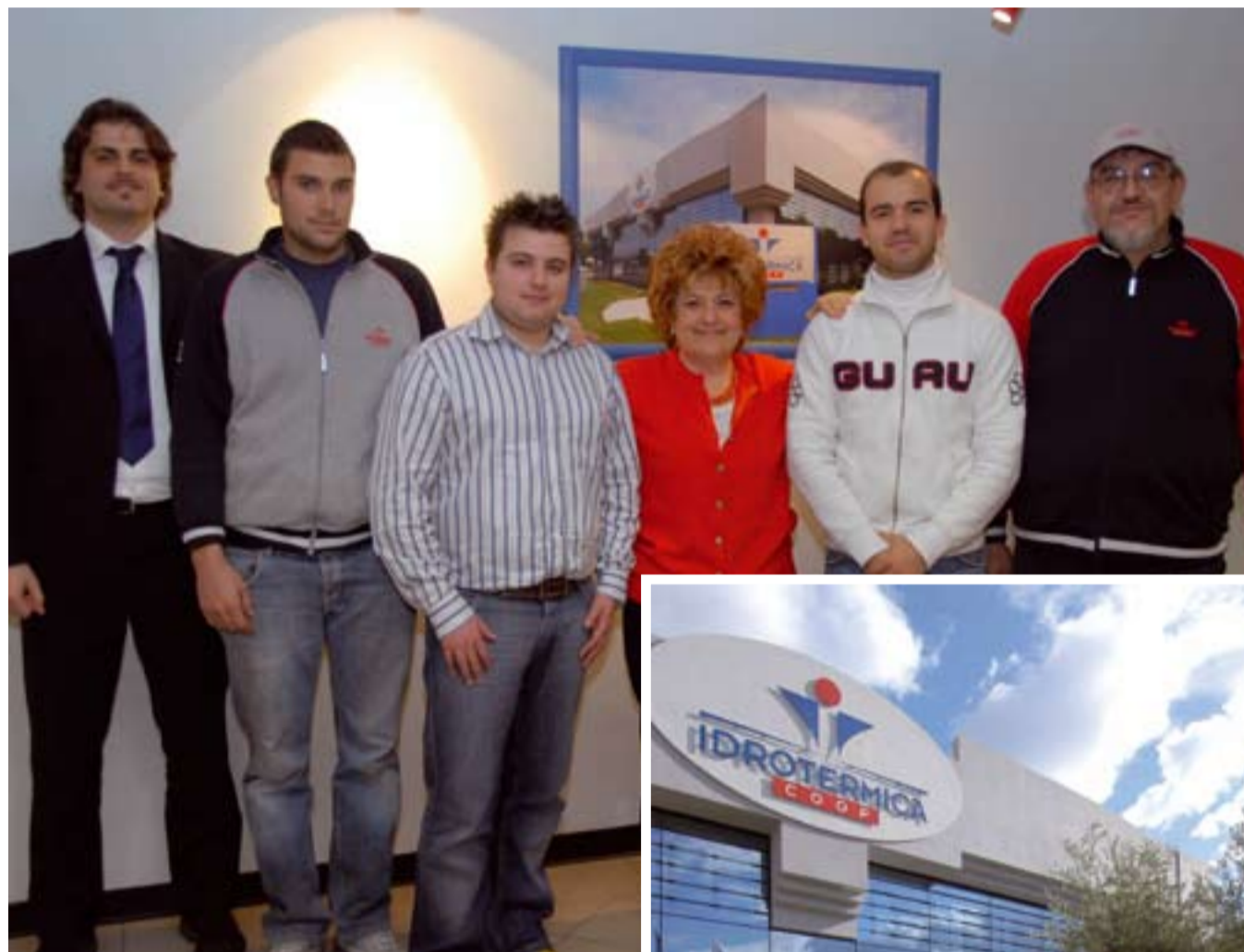
La presidente di Idrotermica Coop con i cinque nuovi soci.

Eppure il 2009 di Idrotermica Coop, che ha appena chiuso un buon pre-