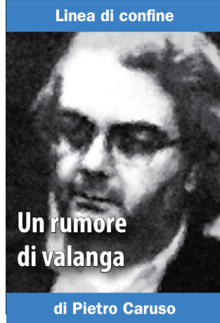
Un rumore di valanga